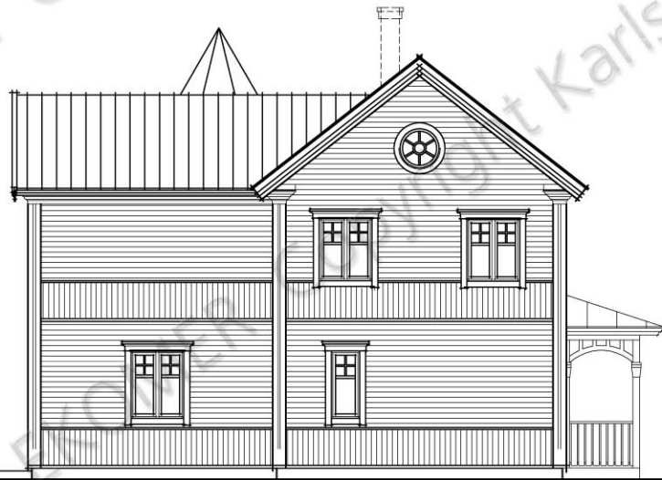
FASAD MOT SYDOST